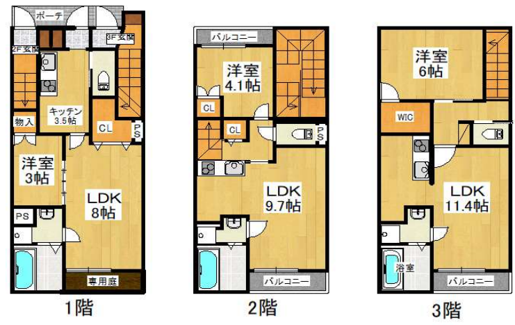
間取りはすべて1号室。2号室は反転タイプ