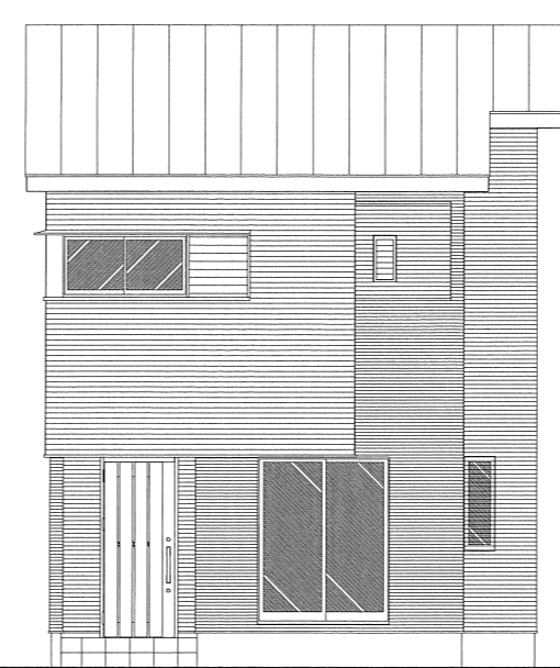
東棟 南立面図 S=1/100